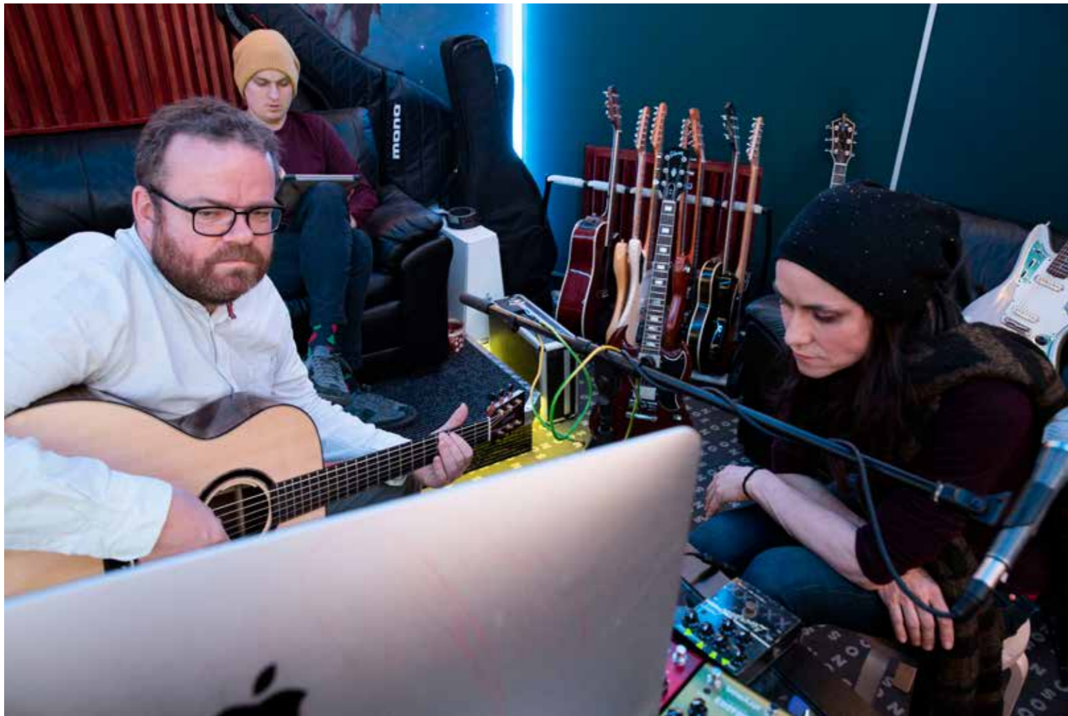
Z natáčení alba Řeka

přinesl hodně důležitý zvukový a produkční vzhled. Vycházíme ale více z nepříhodných věcí a hrajeme i něco z toho, co hraju já sama na sólových představeních. Teď to teprve procesujeme, baví mě směr, kterým se to ubírá. Cítím tam potenciál, oběma nám to něco otevírá. Necháváme si i nějaký prostor pro improvizaci naživo.