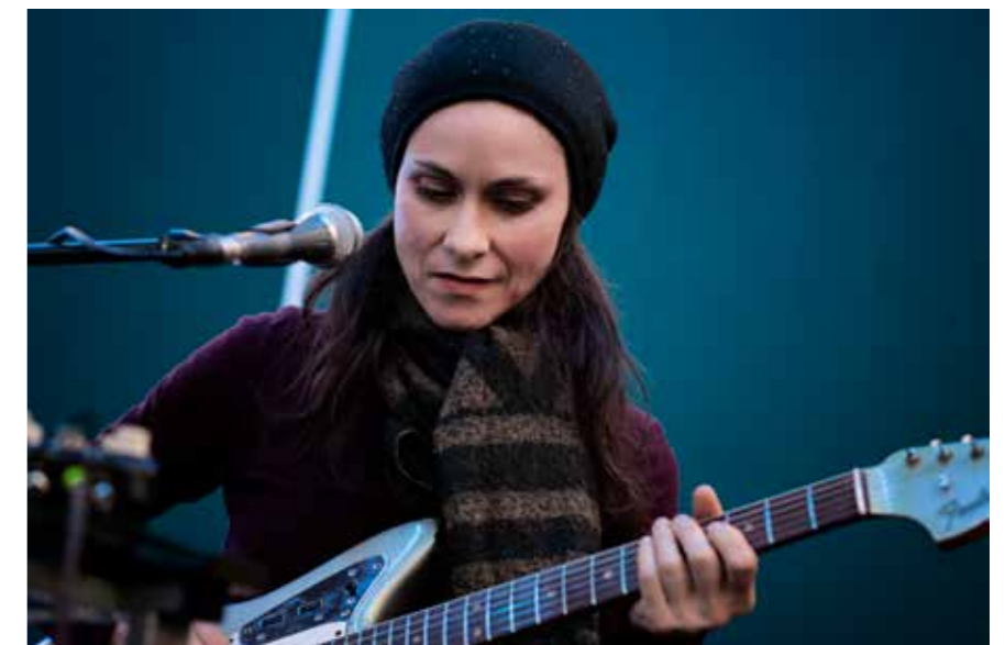
Z natáčení alba Řeka

Každý a každá jdeme životem a procházíme nějakými těžkostmi. Jak do toho přišla pandemie, tak pro mě to téma ještě zvýraznila. Všechny nás to dostalo mimo komfortní zónu. Jenže krizové situace vybarvují naše povahy: rodí se v nich vyprávění, posilují příběhy. Moje Řeka se najednou vyjevovovala snáz. Takhle jsem tu pandemii cítila, když jsme natáčeli Řeku: paradoxně jsem ten rok prožila hodně kreativně. ☒